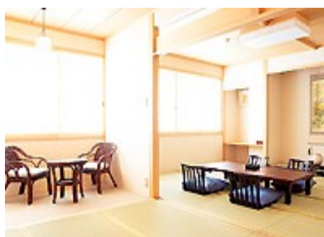
ゆったりと、くつろげる和室